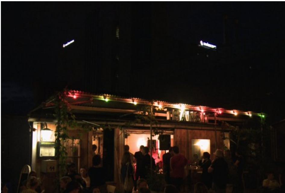
'Service inbegriffen' - 'Transit' bei Nacht

Das Stammtisch-Niveau wird von Politikern gerne herbeizitiert, wenn es darum geht, sein eigenes Niveau als Höherstehendes festzulegen. Aber wie hoch sind eigentlich Stammtische in der Schweiz? Eric Bergkraut geht der Frage in einer wunderbar stillen Bilderreise durchs Land nach.